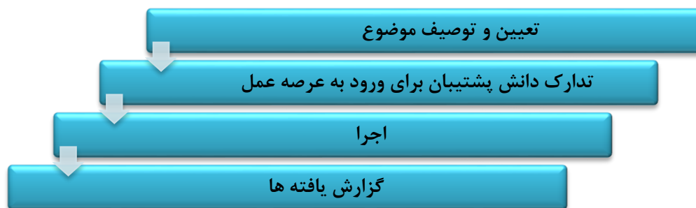
شکل شماره ۲: چرخه درس آموزش پژوهی در عرصه عمل

درس آموزش پژوهی در عرصه عمل در دوره مهارت آموزی به ۲ مرحله تقسیم می شود. بر این اساس مرحله اول شامل «تعیین و توصیف موضوع» و «تدارک دانش پشتیبان برای ورود به عرصه عمل» و مرحله دوم شامل «اجرا» و «گزارش یافته ها» تقسیم می شود. شرح فعالیت های مهارت آموز در هر یک از مراحل فوق، در بند ۵ همین فصل (کاربرگ های ارزشیابی درس آموزش پژوهی) بیان شده است.